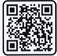
สิ่งที่ส่งมาด้วย ๔