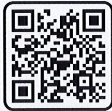
สิ่งที่ส่งมาด้วย ๒